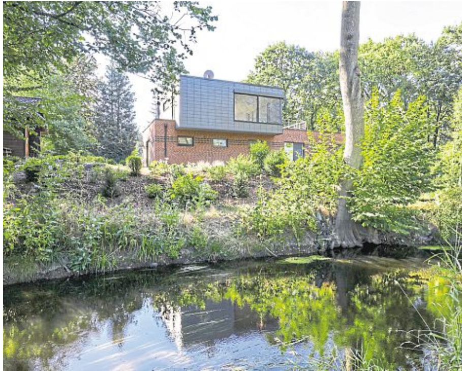
Wohnen in und mit der Natur: Bei der Modernisierung erhielt der klassische Winkelbungalow aus den 60er Jahren anstatt des Walmdaches einen modernen Kubus als Aufbau. Im Materialmix mit den nordisch geprägten Klinkern verleiht die Schieferfassade aus großformatigen Steinen dem Gebäude zeitlose Eleganz und dauerhaften Schutz.

einer Modernisierung enge Grenzen. Mit Segen des Bauamtes konnte im Rahmen des bestehenden Grundrisses energetisch modernisiert und mit Bedacht erweitert werden. Die Kalksandsteinverblendung wurde entfernt, das nur 24 Zentimeter starke Ziegelmauerwerk erhielt rundum eine 16 Zentimeter dicke Zusatzdämmung, die Fensterflächen wurden bis zur Bodenplatte vergrößert. Das in die Jahre gekommene Walmdach wurde abgerissen und auf der vorhandenen Betondecke geschickt ein Kubus aufgesetzt. An der natürlichen Umgebung sollte sich die Gesamtgestaltung orientieren. Während das Untergeschoss klassisch wieder mit einem Verblendmauerwerk bekleidet wurde, schimmert das in Holzständerbauweise aufgesetzte 10 mal 10 Meter große Quadrat in dunklem Schiefer. Durch die „Variable Rechteck Deckung“ entstand ein flächiges Deckbild, das mit den roten und schwarzen Klinkern perfekt harmoniert. Die Bauherrin, selbst Architektin, entschied sich bewusst für die Materialkombination, die robust, inmitten der grünen Lunge lange pflegearm und zeitlos modern ist. Durch große Glasflächen und von der neuen Dachterrasse genießen die Besitzer heute aus ihren zusätzlich gewonnenen 100