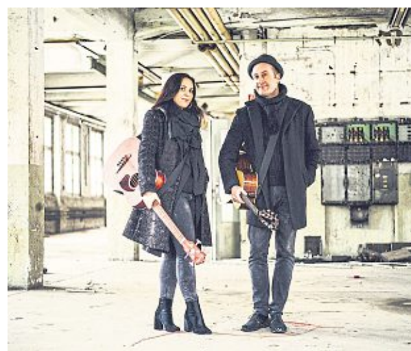
Tonland schafft eine eigene musikalische Welt.

Bühne. Das Pop-Duo versteht sich als Botschafter von neuem Liedgut und erschafft eine eigene musikalische Welt unter dem Leitsatz: Zwei Menschen, zwei Stimmen, eine Gitarre, viel Gefühl. Ihre selbstgeschriebenen Texte und vielseitigen Melodien sind immer unterlegt von ihrem perfekt harmonisierenden zweistimmigen Gesang. Die Stärke und Kraft der beiden Stimmen machen jedes einzelne Lied unverwechselbar. Tonland gibt es nicht nur akustisch zu hören. Die beiden Musiker stellen ihre Musik unter-mal mit wabernden Elektro-Klängen dem Publikum vor, bleiben ihrem unverwechselbaren Stil dabei immer treu. Die Veranstaltung beginnt um 19.30 Uhr in der Musikschule KlangArt – „Die Werkstatt“. Der Eintritt beträgt 18 €. Eine tele-