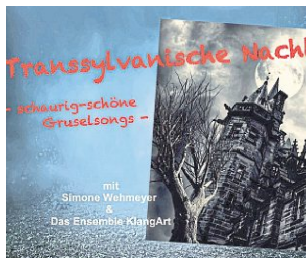
Es wird schaurig im Oktober.

Humor einen Abend mit schaurigen Hits und gruseligen Klassikern. Das große Schlottern beginnt um 19.30 Uhr in der Musikschule KlangArt – „Die Werkstatt“. Der Eintritt beträgt 16 €. Eine telefonische Kartenreservierung ist unbedingt notwendig unter ☎ 0170 65 65 838. Bei allen Veranstaltungen sind die aktuellen, gesetzlichen Hygienevorschriften, sowie die der Veranstalter, unbedingt einzuhalten. -red-