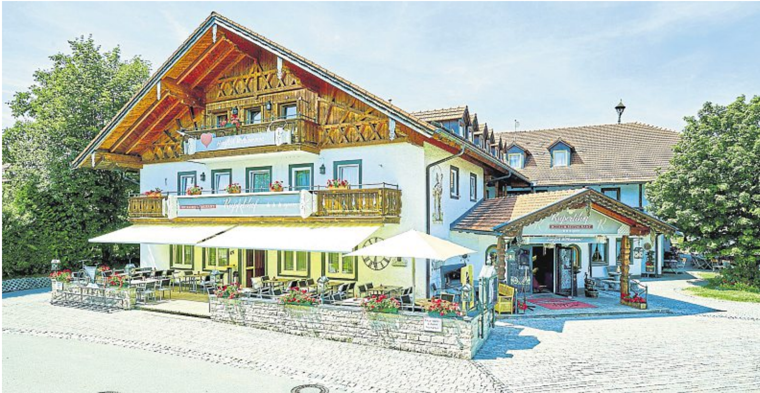
Die traumhafte Lage des Rupertihofs im bayrischen Voralpenland ist für Urlauber ideal – imposante Berge, wunderschöne Täler, weite Landschaften, blaue Seen, interessante Städte sowie verschiedenste Ausflugsziele, Attraktionen und Sehenswürdigkeiten in der Region rund um das Hotel machen einen Urlaub hier immer „zu kurz“.

Der Rupertihof hat eine lange Tradition. In den letzten Monaten hat sich das beliebte Haus neu herausgeputzt. Feinschmecker können sich auf das komplett renovierte Restaurant freuen, in dem vor den Augen der Gäs-