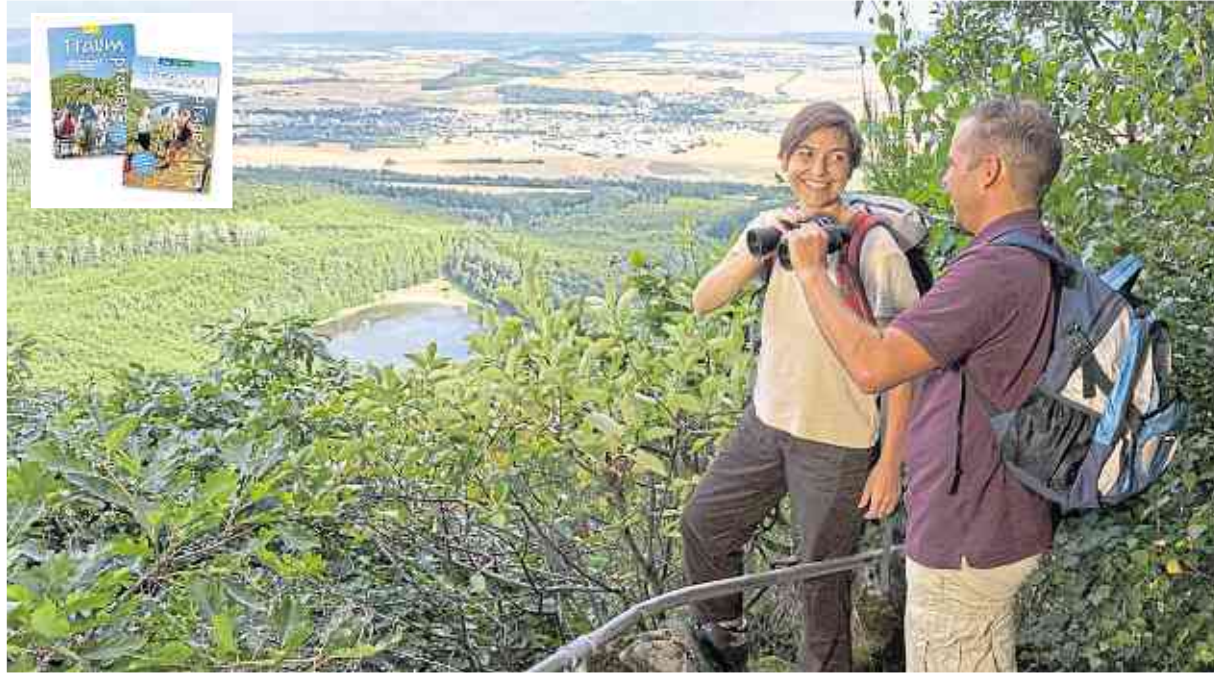
Der Pellener Seepfad glänzt mit wunderbaren Weitblicken über das Neuwieder Becken.

Der Pellener Seepfad führt uns entlang von Holzskulpturen, die für einen Hauch von Kunstausstellung mit-