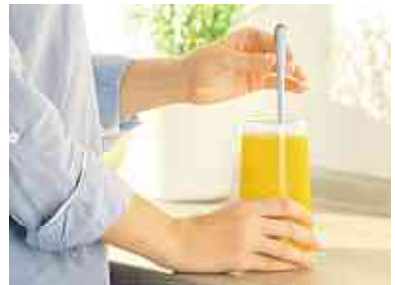
Kijimea Regularis hilft bei Verstopfung, träger Verdauung und einem Blähbauch – einfach einrühren und trinken

Die Verdauung kommt auf natürliche Weise wieder in Schwung und die Verstopfung löst sich – planbar und zuverlässig. Zusätzlich reduziert Kijimea Regularis die Gase im Darm. Der Blähbauch verschwindet. Kijimea Regularis ist rezeptfrei in jeder Apotheke erhältlich.