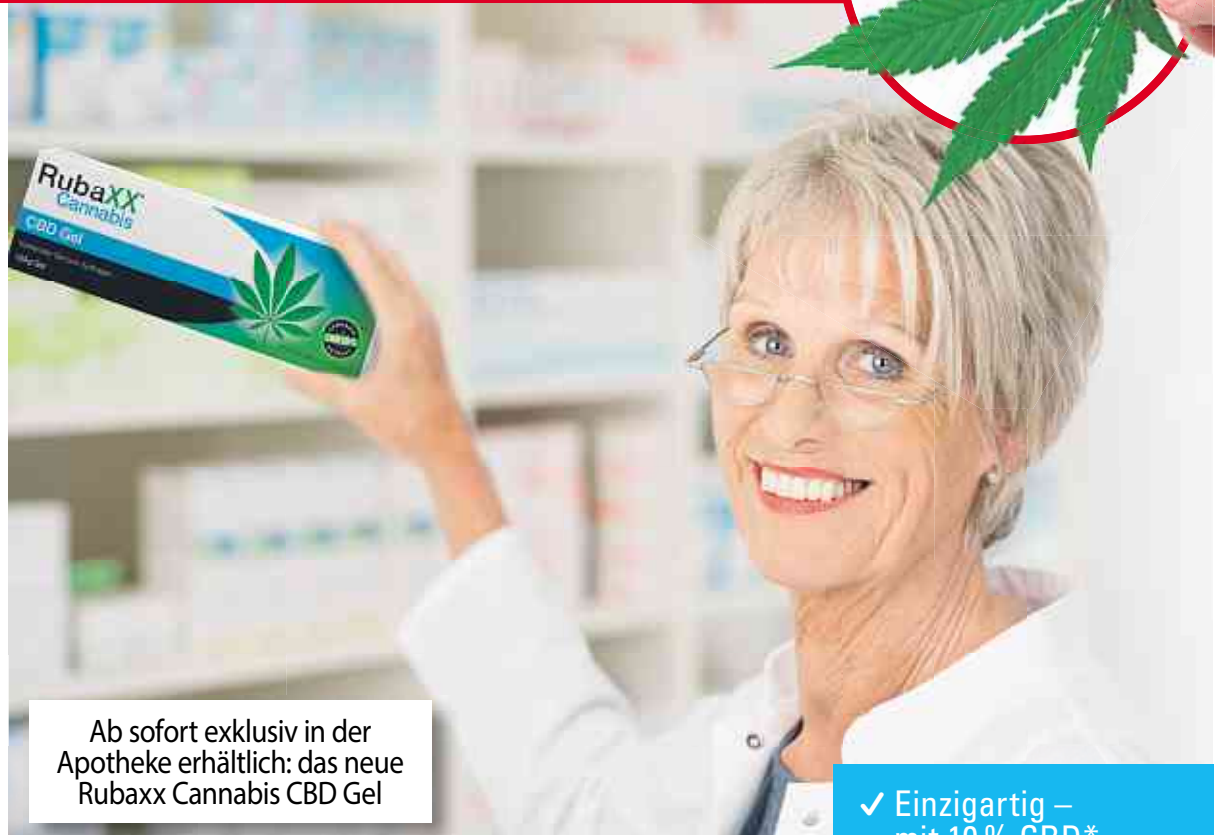
Ab sofort exklusiv in der Apotheke erhältlich: das neue Rubaxx Cannabis CBD Gel

Experten der Qualitätsmarke Rubaxx haben nach einer Cannabispflanze mit hohem CBD-Gehalt gesucht – mit Erfolg! Aus einer speziellen Pflanze der Cannabissorte sativa L. wird mittels eines komplexen CO 2 -Extraktionsverfahrens reines CBD isoliert. Das hochwertige CBD ist jetzt in dem neuen Rubaxx Cannabis CBD Gel verarbeitet. Neben der einzigartigen