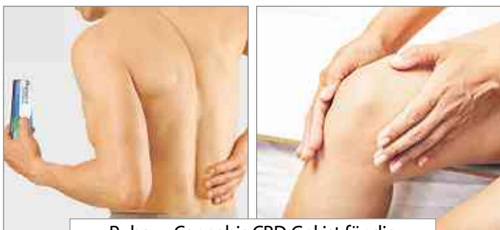
Rubaxx Cannabis CBD Gel ist für die tägliche Anwendung geeignet

Überzeugen auch Sie sich von Rubaxx Cannabis CBD Gel, exklusiv in der Apotheke erhältlich.