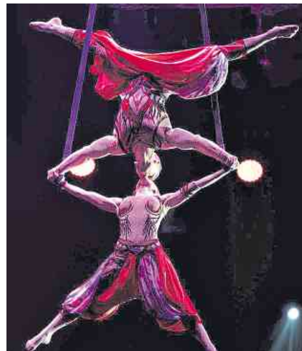
Ein Kopf-an-Kopf-Hängen: Das Duo Idols begeisterte schon das Publikum des Cirque du Soleil.

Comedy trifft Artistik: Erleben Sie Turner der Belgischen Nationalmannschaft und der Turn-Bundesliga in einer Show der besonderen Art. „Frisch, fromm, fröhlich, frei“, ganz nach dem Motto von Turnvater Jahn, sehen sie die moderne Version von Camping kombiniert mit Sport.