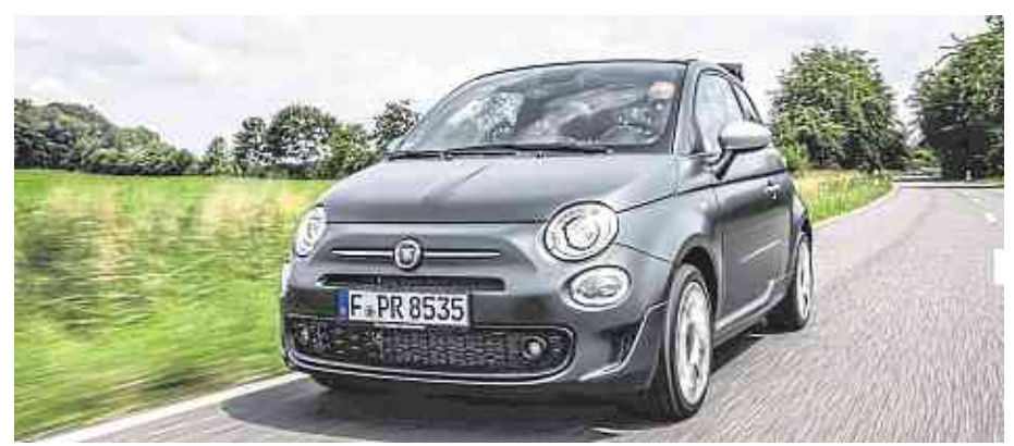
Dynamisch und elegant: der Fiat 500.

Kraftstoffverbrauch in l/100 km kombiniert für Peugeot 3008 Hybrid4 mit 1.6 l PureTech 200 (147 kW) und zwei Elektromotoren mit 112/110 PS (81/83 kW); bis zu 1,41 CO2-Emissionen in g/km kombiniert; bis zu 321; Energieverbrauch: bis zu 17,4 kWh/100 km. Die Kraftstoff- bzw. Energieverbrauchs- und CO2-Emissionswerte wurden nach der neu eingeführten „Worldwide harmonized Light vehicles Test Procedure“ (WLTP) ermittelt. Aufgrund der realistischeren Prüfbedingungen fallen die Kraftstoff- bzw. Energieverbrauchs- und CO2-Emissionswerte häufig höher aus als die nach NEFZ gemessenen Werte.