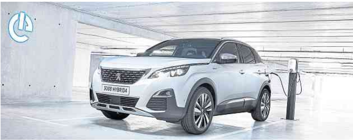
Der Peugeot 3008 ist das leistungsstärkste Serienfahrzeug der Löwenmarke.

Der neue Peugeot 3008 GT HYBRID4 liefert eine Leistung von 220 kW (300 PS) und mit die besten CO2-Emissionswerte auf dem Markt für Plug-In Hybride. Denn die neue Modellvariante weist nach dem aktuellen WLTP-Verfahren einen Wert von 29 g CO2/km auf und besitzt im reinen Elektromodus eine Reichweite von 59 km. Bereits im Herbst 2019 ist der neue Peugeot 3008 GT Hybrid4 in Deutschland bestellbar.