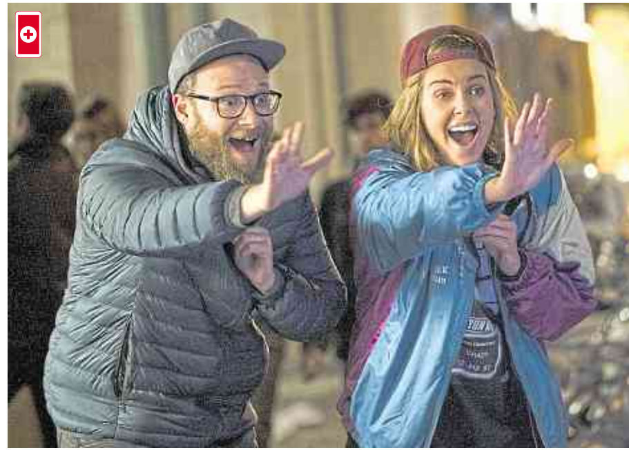
In „Long Shot“ versucht der chaotische Fred seiner Jugendliebe Charlotte, die mittlerweile erfolgreiche Politikerin ist, näher zu kommen.

Bei den Kazé Anime Nights gibt es wieder die besten neuen Animes auf der großen Leinwand zu bewundern. Das Cine 5 Kino in Asbach zeigt am Dienstag, 25. Juni (20.15 Uhr), den Anime „Detektiv Conan – The Movie (22): Zero der Vollstrecker“.