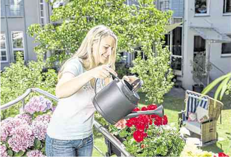
Flüssigdünger ist äußerst ergiebig: Ein Liter ist ausreichend für etwa 500 Liter Gießwasser.

Das hat der Rekordsommer 2018 ganz deutlich gezeigt: Teil- oder vollautomatische Bewässerungssysteme gehörten in diesem Jahr zu den großen Verkaufsschlägern. Diese Anlagen unterstützen uns aber nicht nur bei der Arbeit, sie haben auch noch weitere Vorteile: Bei einer Tropfbewässerung wird die Erde nicht nur gleichmäßig durchfeuchtet und jede Pflanze punktgenau versorgt, auch der Wasserverbrauch wird im Rahmen gehalten, da die Verdunstungsverluste gering sind. Bei unterirdisch verlegten Tropfrohren gehen diese sogar gegen Null. Ein komplett selbstständig arbeitendes System, das die Bodenfeuchte misst und darauf entsprechend reagiert, ist zudem in der Urlaubszeit praktisch und zuverlässig: Die Pflanzen bleiben grün, ohne dass der Nachbar gießen muss... „Richtig smart wird der Garten oder Topfgarten aber erst dann, wenn auch die Düngung der Pflanzen automatisch zusammen mit der Wasserversorgung erfolgt. Mit den richtigen Beimischgeräten ist das heute problemlos möglich“, sagt Andrea Neuenschwander, Umweltingenieurin beim