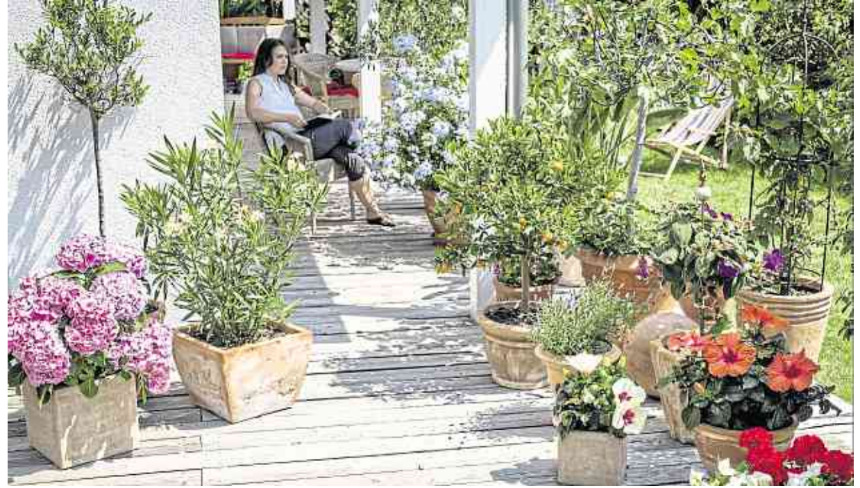
Vor allem Pflanzen, die auf Balkon und Terrasse in Kästen und Kübeln wachsen, sind für die regelmäßige Versorgung mit Flüssigdünger dankbar.

dankbar. Denn anders als in der Natur gibt es in dem begrenzten Erdreich kein ausreichend aktives Bodenleben, bei dem Regenwürmer und Bakterien herabfallende und abgestorbene Pflanzenteile zu Nährstoffen verarbeiten.“ so Neuenschwander. „Flüssiger Volldünger ist besonders schnell wirksam, da die Mineralien und Spurenelemente von den Wurzeln der verschiedenen Gewächse sofort aufgenommen werden können.“ Dabei ist es egal, ob die Versorgung über eine Bewässerungsanlage verläuft oder ob die Lösung dem Wasser in der Gießkanne beigegeben wird.