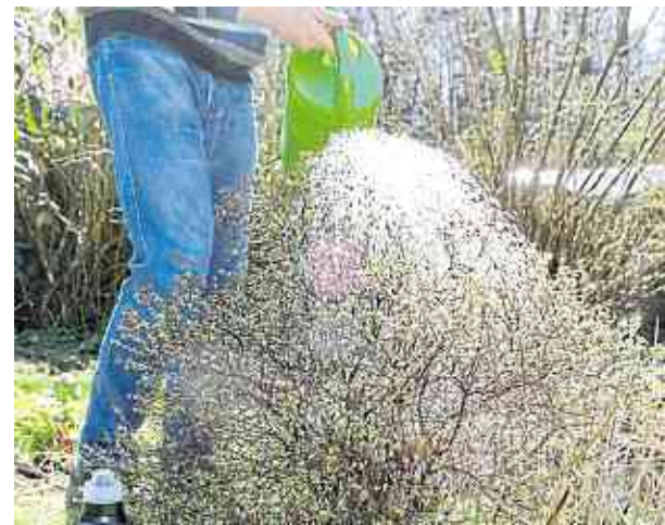
Was viele Hobbygärtner nicht wissen: Pflanzen können Nährstoffe nicht nur über die Wurzeln, sondern auch über das oberirdische Grün aufnehmen. Durch Übergießen gelangen sie ganz unmittelbar an den Ort des Bedarfs.

Noch schneller kommen die Nährstoffe mit der sogenannten Blattdüngung zum Einsatz. Was auch viele Hobbygärtner nicht wissen: Pflanzen können diese nämlich nicht nur über die Wurzeln, sondern auch über das oberirdische Grün aufnehmen. Durch Übergießen gelangen die Wirkstoffe ganz unmittelbar an den Ort des Bedarfs. Dies ist vor allem sinnvoll, um eine temporäre Mangelsituation bei Zierpflanzen zu beheben, etwa wenn bei Kalküberschuss im Erdreich oder infolge langer Trockenheit Nährstoffe im Boden fixiert werden. Natürlich wird auch dabei die Düngergelösung nicht direkt ausgebracht, sondern ebenfalls