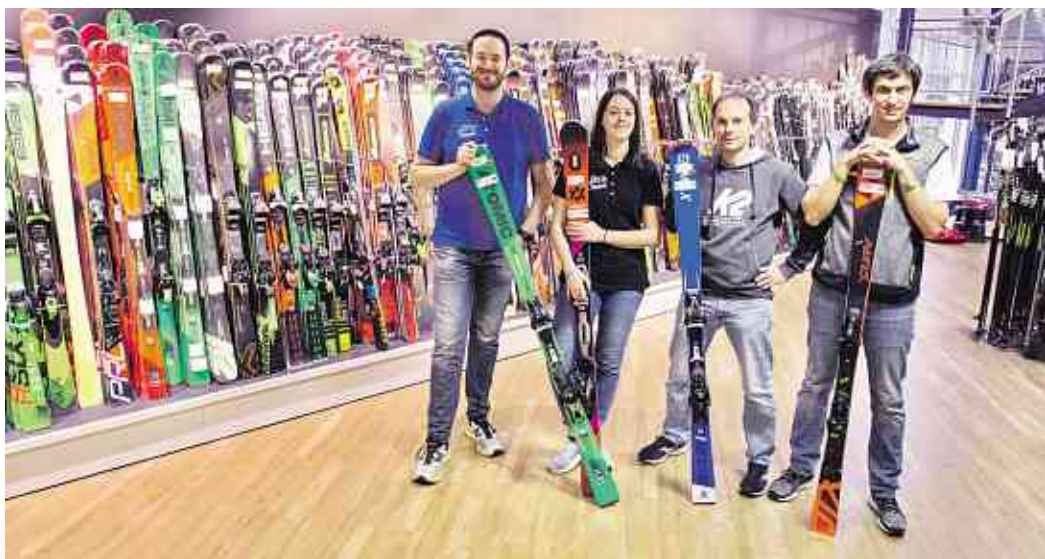
Hilft gerne bei der Auswahl der richtigen Skier: das Team der Wintersportabteilung.

Ideal ergänzt wird das Angebot durch den KAPS-Ski- und Snowboard-Service. Die Ski-Experten schleifen, wachsen und polieren Ski und Snowboards. Auf Wunsch bessern sie auch den Belag aus und sorgen mittels modernster Computertechnik für die richtige Bindungseinstellung. Die Mitarbeiter sind vom Deutschen Skiverband (DSV) für Bindungsmontage/Bindungseinstellung zertifiziert und lassen sich überdies jedes Jahr freiwillig als Profi-Skiwerkstatt vom DSV prüfen. Immer top präpariert ist die Winterrüstung übrigens im Ski-/Snowboard-Verleih von KAPS. Und last, but not least, bietet das Sport- und Modehaus seinen Kunden eine Ski-/Snowboard-Versicherung gegen Bruch und Diebstahl an.