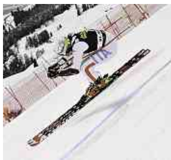
Mit KAPS VIP-Tickets für den Ski alpin Weltcup in Italien gewinnen.

die Anpassung des Außenschuhs mit Fischer Vacuum Full Fit und des Innenschuhs mit Fischer Active Fit Zones informieren. Auch die Kultmarke Bogner stellt sich an den Skischuhtagen vor. Während die Kunden die neuen Skilooks entdecken, reicht ein professioneller Barkeeper Skiwater und als alkoholische Alternative einen Drink – eine Kombination aus dem beerigen Gspusi Gin, frischem Zitronensaft und Skiwater, dekoriert mit Rosenblüten.