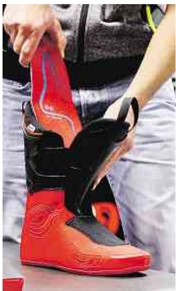
Mittels Fußanalyse wird die Einlage individuell angepasst.

SOLMS-OBERBIEL Wintergaudi ist das Motto der aktuellen Wintersportsaison im Sport- und Modehaus KAPS. Und Spaß auf der Piste garantiert der individuell angepasste Skischuh. Warum das so ist und welche innovativen Anpassungstechnologien es gibt, ist das zentrale Thema der Skischuhtage.