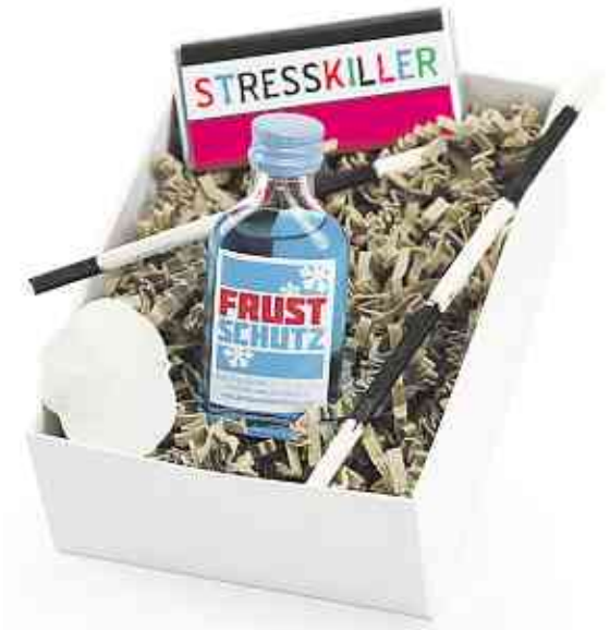
Die Mitbringbox „Frustschutz“ ist eine humorvolle, liebevoll dekorierte Geschenkbox, wenn sich einmal eine schlechte Phase bei der besten Freundin anbahnt.

auf dem Tee) und fertig ist die Überraschung. Eine ganz besondere „Wellnessbox“ kann die Laune auch an grauen Tagen heben: Die im Set enthaltene Seife kann die Laune durch Aussehen oder Geruch heben und ein Massageschwamm macht das Set perfekt.