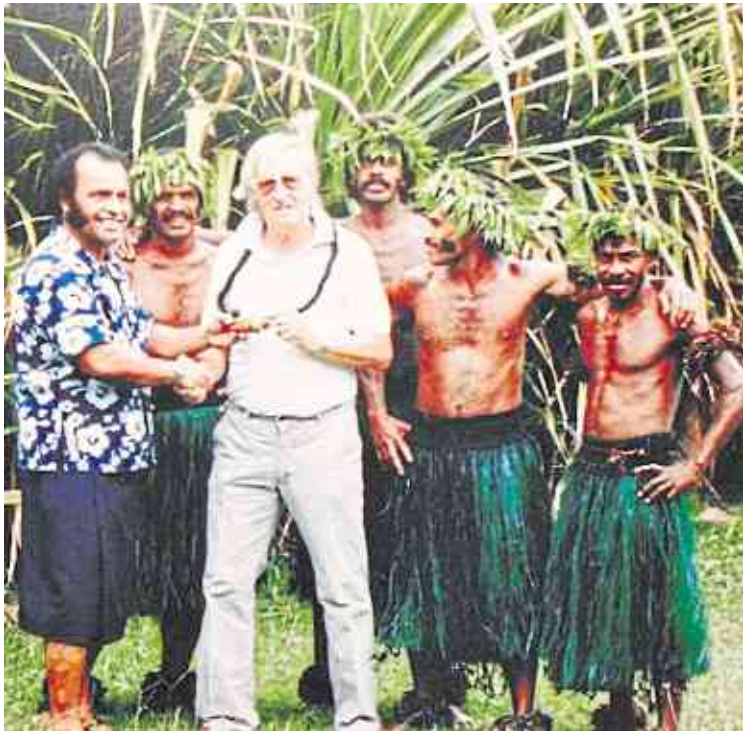
Rudi Gutendorf trainierte 1976 in der Karibik auf den Inseln Trinidad und Tobago, Grenada sowie Antigua und Barbuda.