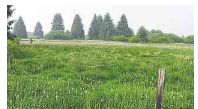
Im Buchhellerthal treffen die Exkursionsteilnehmer auf große Bergwiesen.