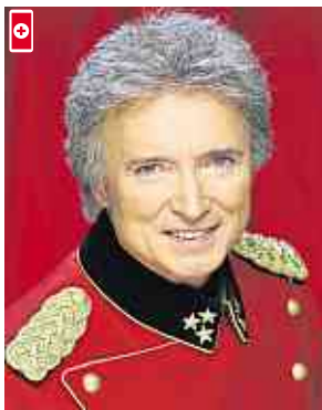
Peter Orloff

ANDERNACH. Peter Orloff und der Schwarzmeer Kosaken-Chor treten am Freitag, 2. März (19 Uhr), in Andernach in der Mittelrheinhalle auf.