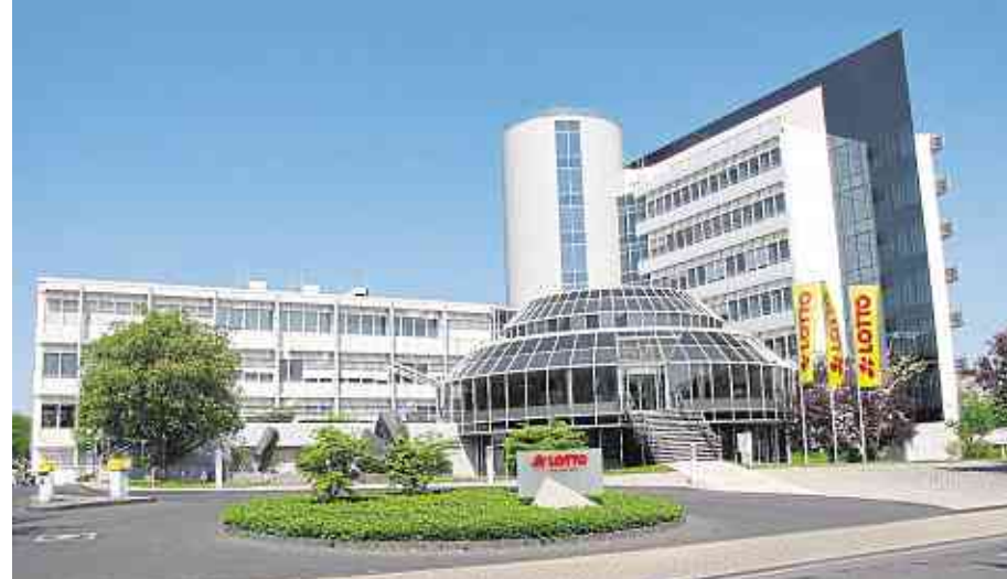
Der Sitz der Lotto-Zentrale ist im Koblenzer Verwaltungszentrum im Rauental.

REGION. Das Koblenzer Glücksspielunternehmen Lotto Rheinland-Pfalz schloss das Jahr 2017 mit einem Gesamtumsatz von rund 363 Mio € ab. Nach fünf Jahren Umsatzsteigerungen in Folge bedeutet das für die bundesweit angebotenen Spielangebote ein Umsatzminus von 6,9 % im Vergleich zum Vorjahr. Nimmt man die erstmals in Rheinland-Pfalz angebotene Jahresendlotterie Neujahrs-Million mit hinzu, beträgt der Rückgang 6,2 %.